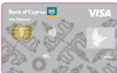
Visa Platinum Credit